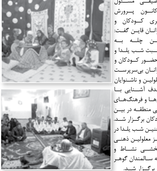
نیز برگزار شد.